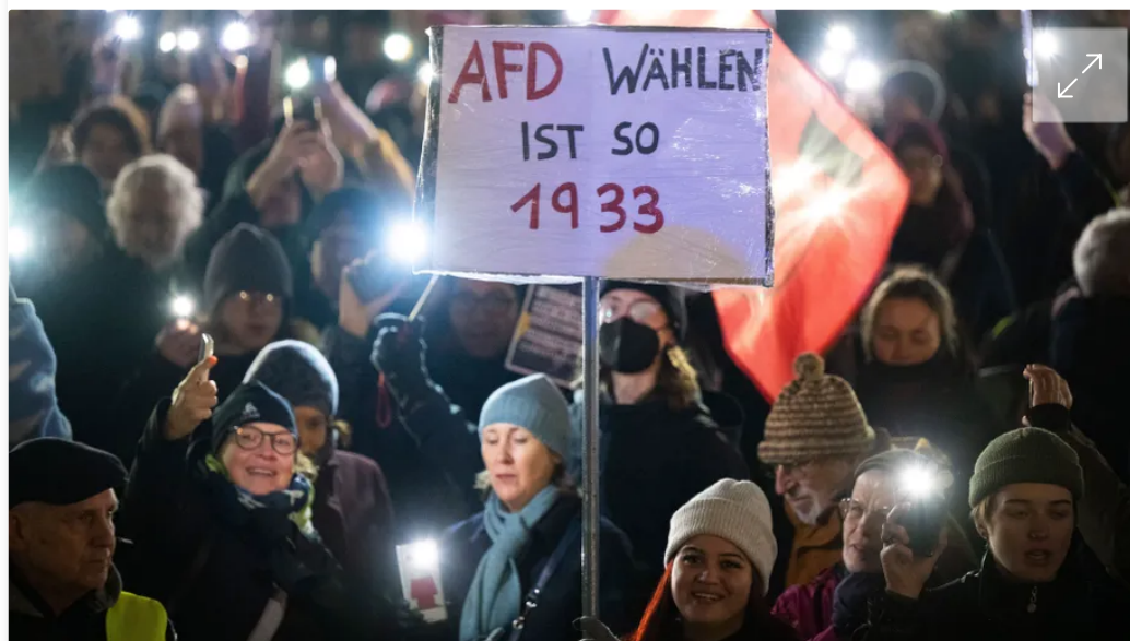
Menschen demonstrieren in Frankfurt am Main gegen Rechtsextremismus